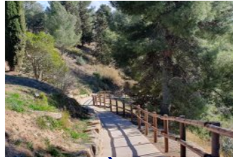
Millora del vial d'enllaç entre els parcs de Vallbona i Valldaura