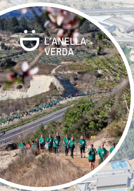
Connexió amb l'Anella Verda dels barris de Fatima, Set Camins i Les Comes