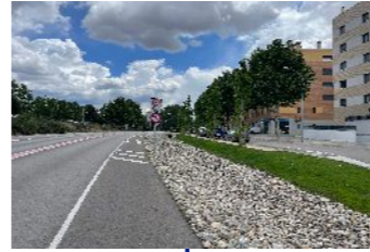
Enjardinament i millora de la vorera de l'av. Mestre Montaner