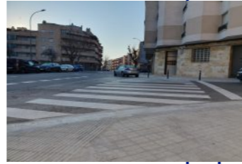
Millora de voreres i accessibilitat de l'av. Dr. Pasteur