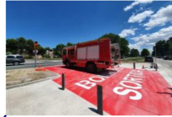
Nova sortida per als serveis d'emergències