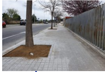
Millora de les voreres al voltant de la residència Pare Vilaseca