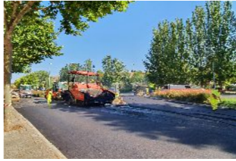
S'han asfaltat el c. La Pobla de Claramunt, av. Mestre Montaner i Catalunya i la zona blanca d'aparcament del carrer Comarca