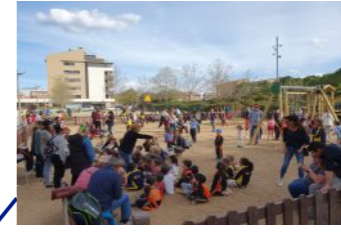
Millora del parc del carrer de La Pobla de Claramunt