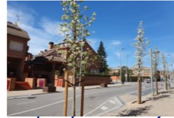
Pla d'arbrat: s'han plantat 90 nous arbres al barri