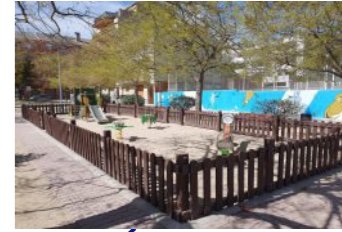
Millora de l'espai central del carrer de Sant Pere Sallavinera