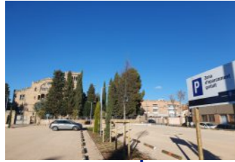
Nova zona blanca de l'Asil amb 150 noves places d'aparcament gratuït