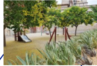
Millora de la plaça de Joan Bas i Jordi