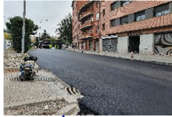
Asfaltatges dels carrers Prat de la Riba, Joan Llimona, J. Martí Franquesa i avinguda Gaudí