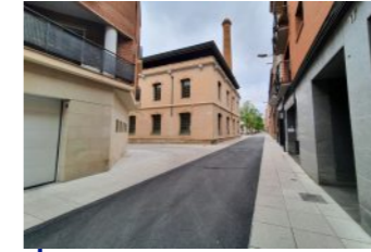
Remodelació dels carrers Galícia, Dansa i Aurora