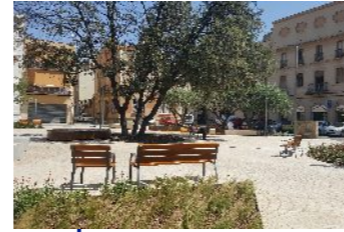
Remodelació de la plaça dels Porcs