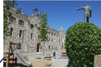
Remodelació de la plaça Castells