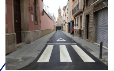
Asfaltatge del carrer del Vidre