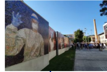
Nou mural de Joan Fontcuberta a la plaça de Cal Font