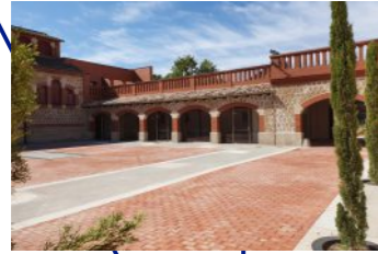
Restauració patrimonial dels patis interiors de l'Escorxador