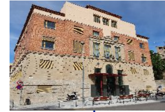
Rehabilitació de l'edifici de la Teneria com a Arxiu Comarcal